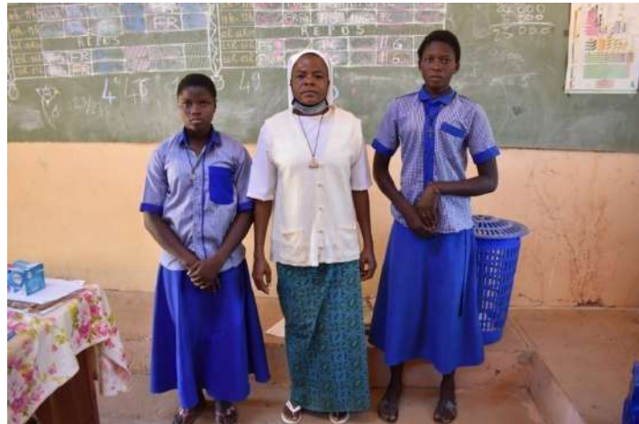
Colegio Notre Dame du Lac, Bam