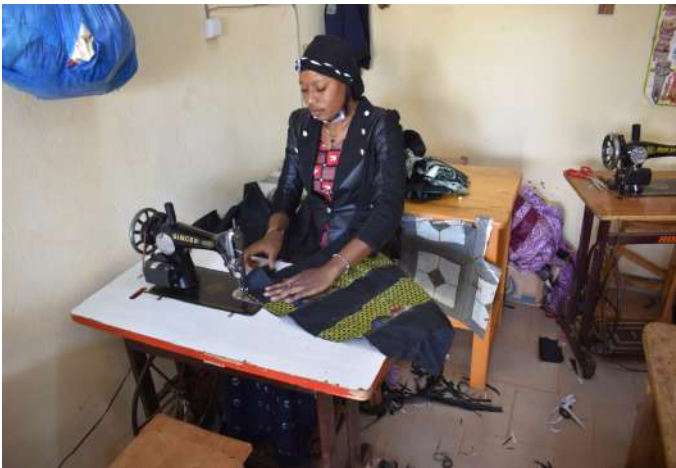
Visita en el taller de costura en Kaya

Se dispone de una ficha de seguimiento que nos permite tener información del rendimiento y comportamiento del chaval.