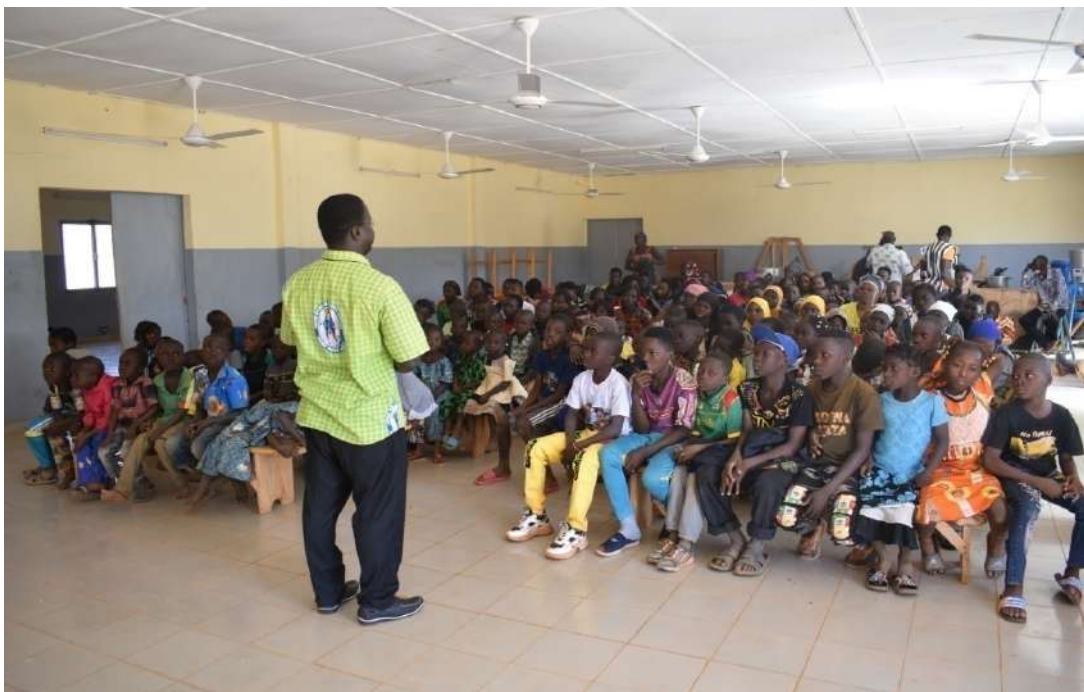
Escuchando la charla sobre la no violencia

La hermana coordinadora en su discurso dio la bienvenida a los chicos, y un sacerdote abordó el tema del día: la no violencia, y esto en relación al contexto de seguridad que atraviesa actualmente Burkina Faso, en particular la región del Centro-Norte. El sacerdote hizo preguntas a los chavales: ¿Por qué somos tantos aquí hoy? Hoy es la Navidad de los niños, respondieron. ¿Qué es la Navidad? Los chicos también dieron una respuesta: la Navidad es el nacimiento de Jesucristo, el salvador del mundo. También agrega otra pregunta: Actualmente, ¿va todo bien en nuestro país? Los niños respondieron : ¡No! Porque gente de mala fe ha hecho su presencia en nuestro país y ha causado desorganización en las familias, en los pueblos.