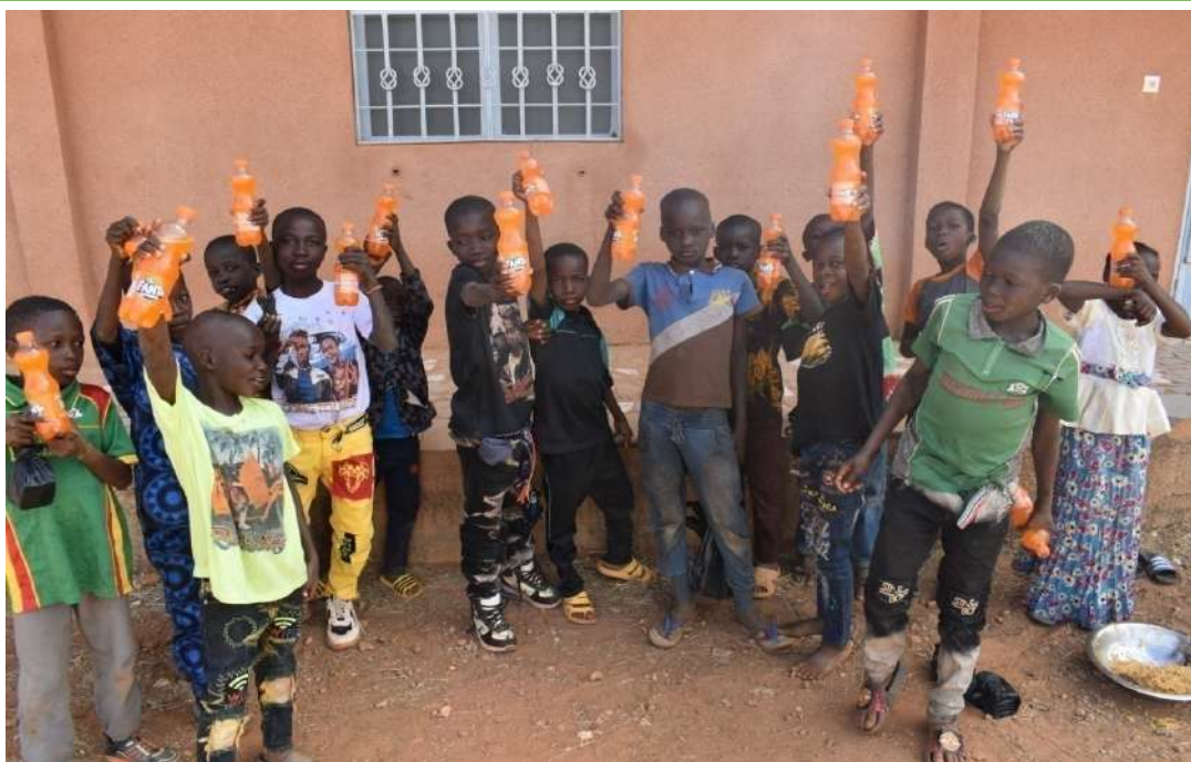
Fiesta en el Centro Polivalente de WBND

Llegaron temprano en la mañana, 8 am y los chavales hicieron fila para ser registrados en la lista de asistencia.