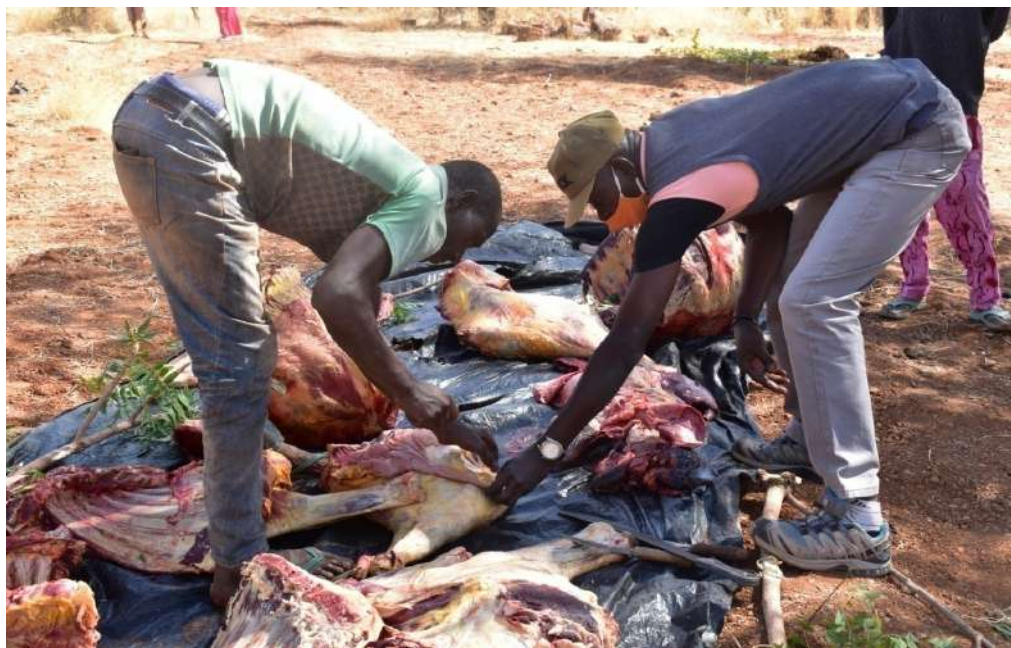
Inspección del veterinario para asegurar la calidad de la carne distribuida

Para paliar esta deficiencia, la asociación WENDBENEDO compró 25 sacos de arroz de 50 kg, 7 bidones de aceite de 20 L y 2 bueyes con el fin de ayudar a niños huérfanos y vulnerables (OEV) para celebrar la Navidad en familia.