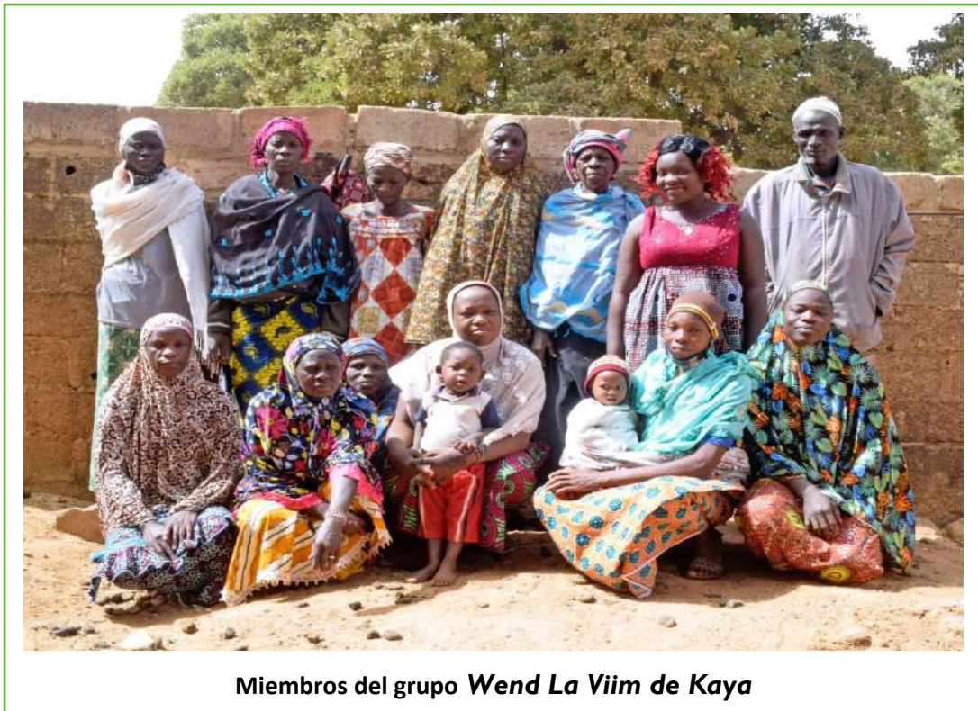
Miembros del grupo Wend La Viim de Kaya