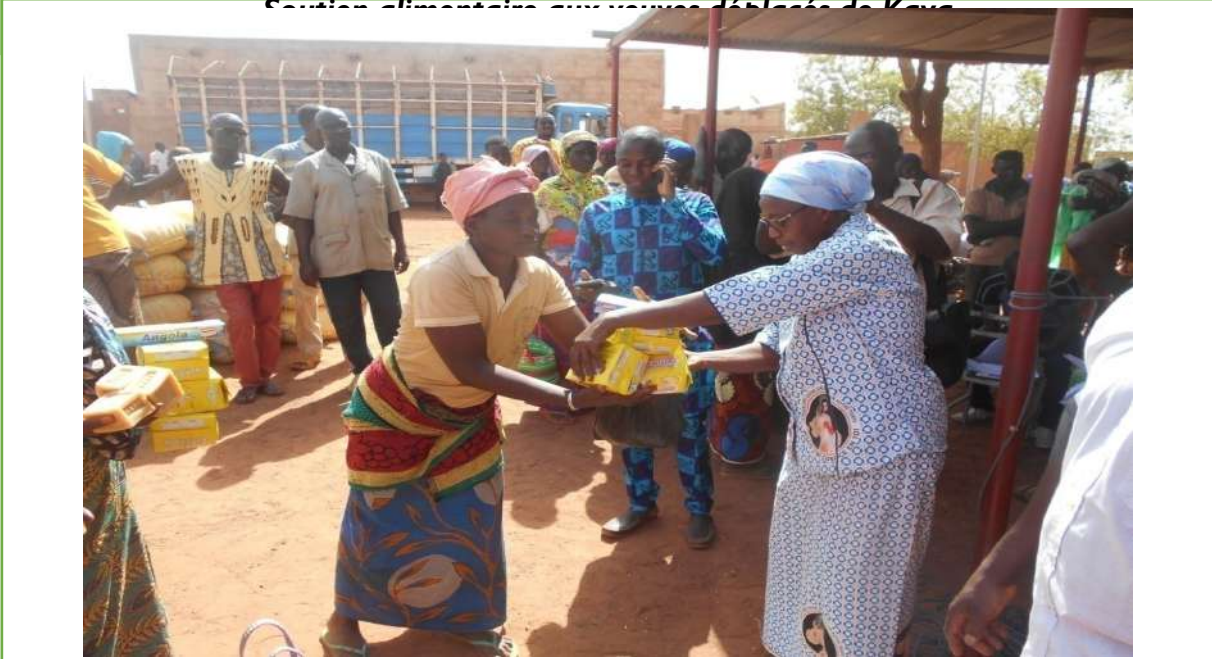
Apoyo alimentario a desplazados internos en Kaya