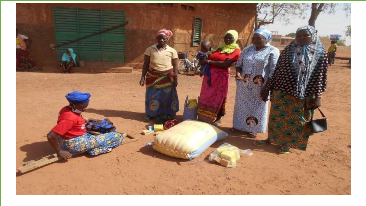
Soutien alimentaire aux femmes déplacées de Kaya

Siempre con el objetivo de ayudar a los más necesitados, la asociación se sintió incapaz de permanecer callada ante las personas desplazadas internamente por el terrorismo, Así llevamos a cabo una misión en Kaya el 16 de abril de 2021 para apoyar a las viudas. Doscientas viudas recibieron cada una 25 kg de maíz y kits de higiene.