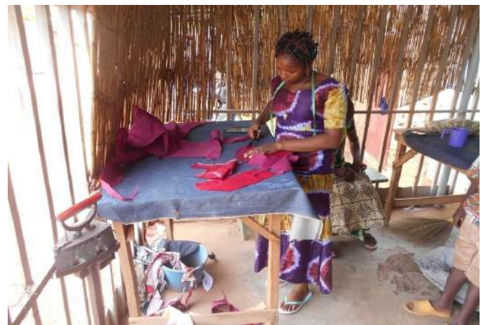
Visita al taller de costura en Rouko