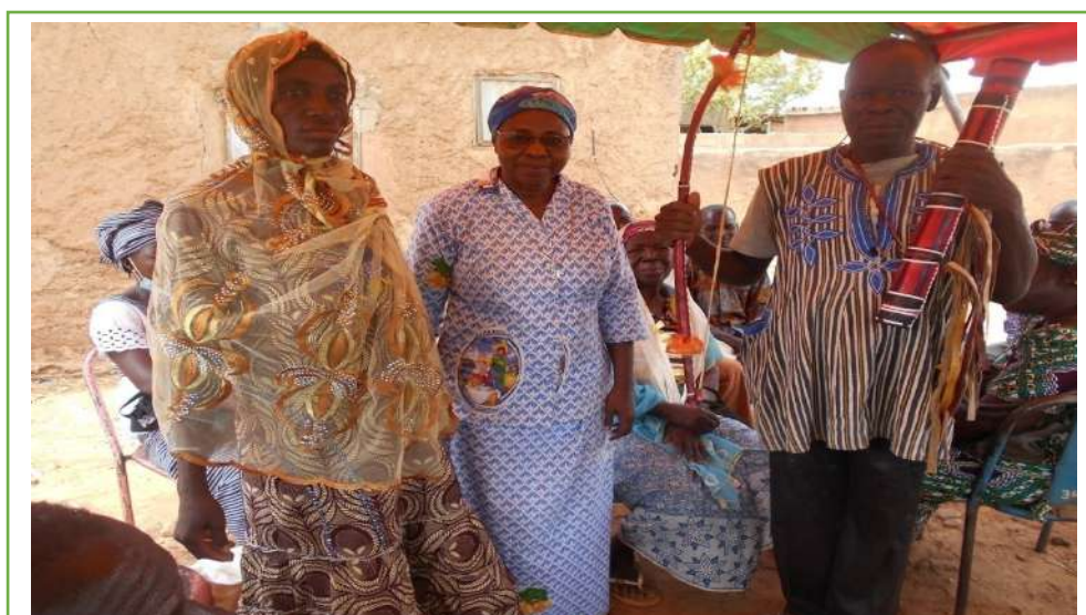
Entrega del arco y las flechas, símbolo de la lucha contra el VIH-sida en Burkina Faso

Con el objetivo de "Fortalecer la solidaridad y la fraternidad dentro de la asociación. Promover un impulso de apertura para comunicar esta llama a otras personas vulnerables de la región Centro Norte ", WBND fue al encuentro de los miembros de la Asociación Yam La Viim de Kaya el 15 de mayo de 2021. Esta salida tuvo entre otros los siguientes objetivos: compartir las vivencias de los integrantes y animar al grupo a luchar para vivir felices. WEND BENEDO patrocina, apoya a este grupo que es miembro de WBND.