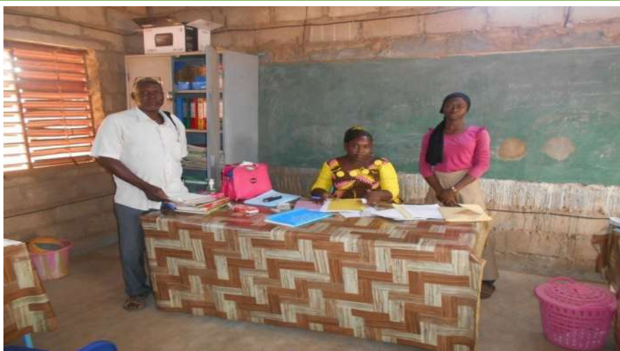
Seguimiento escolar en el liceo municipal de Kaya

El seguimiento escolar es un elemento esencial en el apoyo a los estudiantes. Da testimonio de la preocupación de la asociación de seguir de cerca los resultados escolares de los niños y su comportamiento en la clase y en los colegios. Durante el año se realizaron un total de noventa y cinco visitas de cincuenta niñas y cuarenta y cinco niños en sus distintas escuelas.