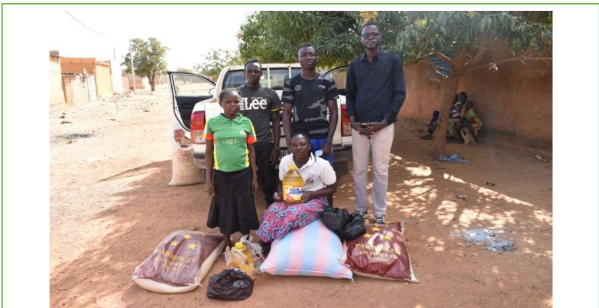
Ayuda alimentaria para nuestros estudiantes en Kaya

Para ayudar a que los chicos de los alojamientos de alquiler o de las casas de acogida estén en buenas condiciones, la asociación les proporciona alimentos consistentes en arroz, maíz, aceite y pescado seco. Esta asignación es trimestral. Un total de trece 13 OEV se beneficiaron de esta dotación.