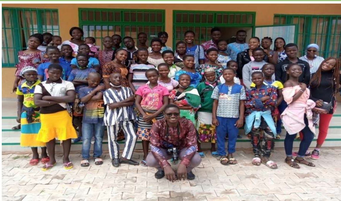
Visita Université Thomas SANKARA, agosto 2021

Fundación Tienda Asilo de San Pedro, Cartagena, España