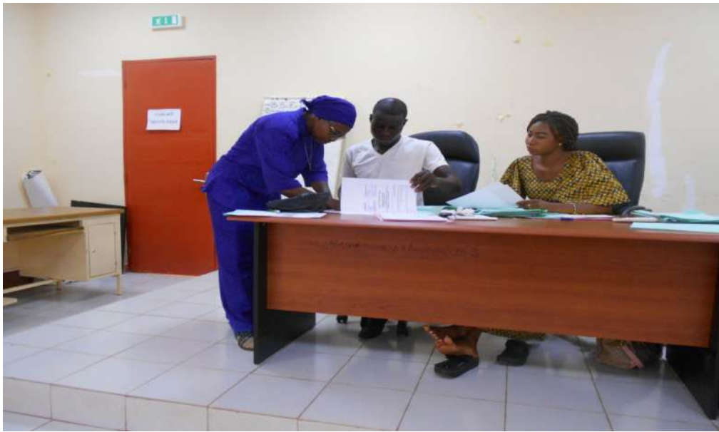
La coordinadora firma el plan de acción SPI/ CNLS 2021 en Kaya

WBND participó en una reunión de asociaciones en la sede de SP/CNLS en Kaya el 10 de mayo de 2021. La coordinadora presentó el cronograma de actividades y el presupuesto detallado de este proyecto para el año 2021.